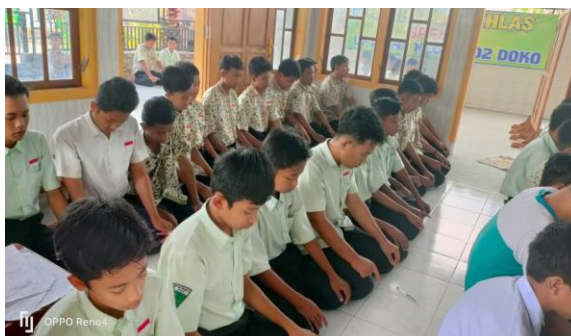
Gambar 4.3 Kegiatan Sholat dhuhur berjamaah