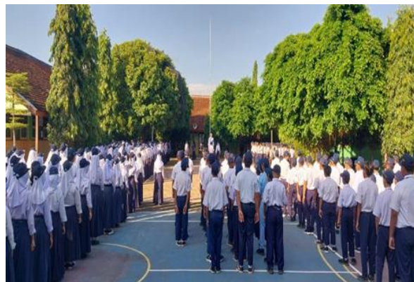
Gambar 4.2 Kegiatan Upacara di sekolah