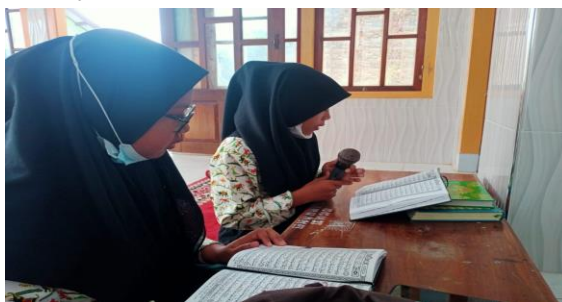
Gambar 4.5 Kegiatan Membaca Al-Qur'an sesuai jadwal kelas

untuk memperbanyak dzikir, membaca Al-Qur'an, dan sholat dhuha maupun sholat sunah Qobliyah dhuhur.