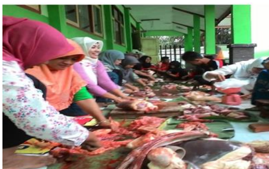
Gambar 4.4 Kegiatan Idul Adha