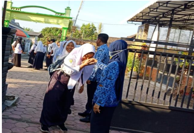
Gambar 4.1 Kegiatan Bersalaman setiap pagi

putri bersalaman dengan Ibu guru dan siswa putra bersalaman dengan dengan Bapak guru. Kegiatan bersalaman menambah rasa hormat siswa ke gurunya, serta menambah keakraban guru dengan siswa.