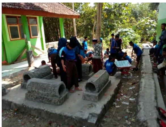
Gambar 6 Kerja Bakti di sekolah setiap seminggu sekali