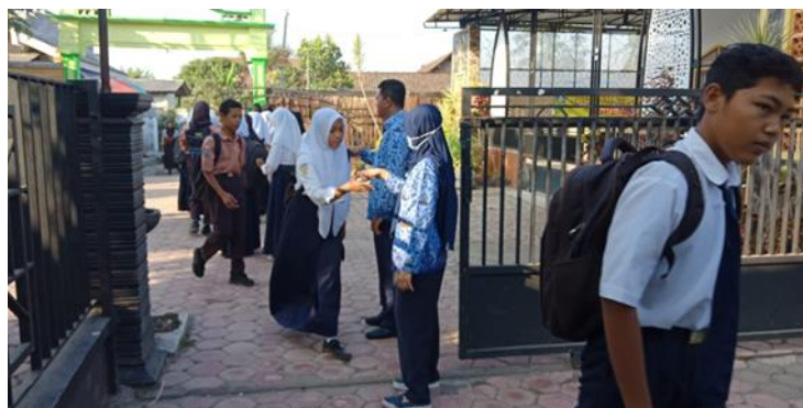
Gambar 7 Pembiasaan Kedisiplinan Datang ke Sekolah