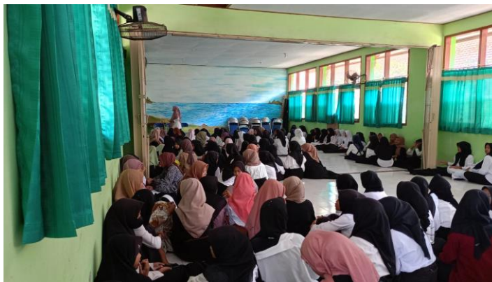
Gambar 3 Istighosah Bersama Kelas VII, VIII dan IX menjelang Ujian Akhir Sekolah

Komponen mendasar pendidikan yang berupaya menanamkan pada anak-anak rasa moralitas dan spiritualitas adalah pendidikan agama. Pentingnya pendidikan agama dalam membentuk karakter moral siswa di kelas terlihat dari mata pelajaran wajib di semua jenjang pendidikan, mulai dari SD, SMP, dan SMA. Oleh karena itu, sekolah harus mampu memberikan pendidikan agama semaksimal mungkin dengan mengintegrasikan keyakinan agama ke dalam kelas. Untuk menerapkan keyakinan agama tersebut secara konsisten dan kooperatif, seluruh pengajar dan siswa harus berkolaborasi. Strategi pendidikan yang dikenal dengan Pendidikan Agama Islam (PAI) sangat menekankan pada prinsip-prinsip inti dan nilai-nilai Islam, seperti Al-Quran dan Sunnah. Setiap sekolah di negara ini mengajarkan pendidikan agama Islam, yang merupakan komponen utama sistem pendidikan (Rozak 2023).