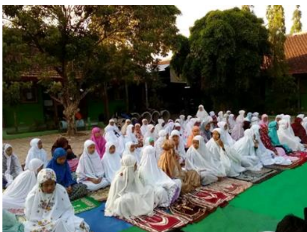
Gambar 5 Pembiasaan shalat berjamaah