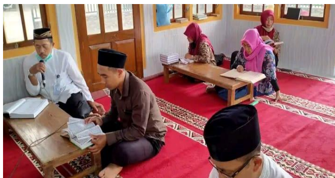
Gambar 4 Pembiasaan membaca Al-Quran