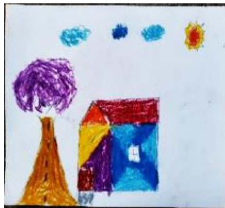
Gambar 2. Gambar "Rumahku" karya Arif

Analisis keilmuan seni rupa pada gambar "Jepaplok" karya Raman dapat disimpulkan bahwa gambar tersebut memiliki unsur bentuk yang ditampilkan dalam bentuk non-geometris (meniru pada alam). Penggoresan garis memiliki spontanitas yang baik, terlihat tanpa ada keragu-raguan dalam merealisasikan objek dengan penggunaan garis-garis lengkung yang terkesan seperti garis dekoratif. Sedangkan warna yang digunakan ialah warna-warna secara realistis atau meniru pada alam dengan latar belakang biru yang melambangkan keagungan, keyakinan dan stabilitas.