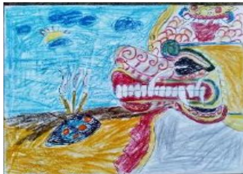
Gambar 1. Gambar “Jepaplok” Karya Raman

Secara visual gambar-gambar yang dibuat anak sekolah dasar khususnya dengan rentang usia 9 tahun ke atas telah mencapai fase realisme semu. Dalam hal ini, karakteristik gambar yang dihasilkan telah menerapkan unsur-unsur visual yang lengkap namun belum sempurna. Pada umumnya, visual karya gambar anak sekolah dasar masih terlihat sederhana dan lugu serta belum memiliki detail yang rinci. Pada bagian ini akan disajikan hasil gambar anak kelas 4 sekolah dasar, yang dianalisis berdasarkan unsur-unsur visual seni rupanya, seperti garis, bentuk, warna, tekstur, dan ruang. Bahari menjelaskan bahwa unsur-unsur terpenting dalam karya seni rupa adalah garis, warna, tekstur atau barik, ruang dan volume (Bahari, 2008: 98).