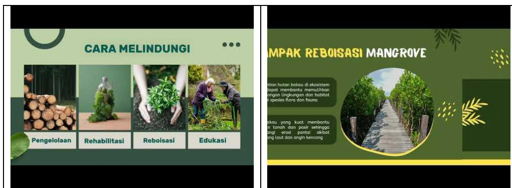
Gambar 2. Contoh video pembelajaran hasil karya siswa (komponen Technology /Teknologi) ( Video pembelajaran tentang mangrove yang diunggah di YouTube )

Hasil proyek siswa ini mengindikasikan bahwa pembelajaran berbasis STEAM mendorong siswa untuk tidak hanya memahami konsep secara teoritis, tetapi juga mampu mengekspresikan pemahaman tersebut melalui karya nyata yang dapat bermanfaat bagi komunitas. Temuan ini sejalan dengan pendapat Santoso dan Mulyani (2023) bahwa pembelajaran berbasis isu lingkungan membangun tanggung jawab ekologis siswa melalui partisipasi aktif dalam pembuatan produk yang berorientasi pelestarian lingkungan.