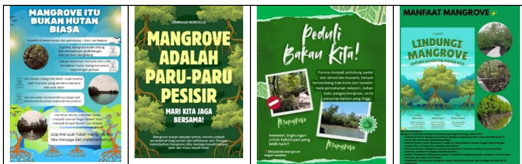
Gambar 1. Contoh poster hasil karya siswa (komponen Art/Seni ) (Poster kampanye pelestarian hutan mangrove yang diunggah di media sosial)

Gambar 1 menampilkan contoh poster kampanye menjaga hutan mangrove yang dihasilkan oleh siswa sebagai luaran komponen Art (Seni) dalam pendekatan STEAM. Poster-poster tersebut memuat unsur judul kegiatan, foto kegiatan, hasil kegiatan, dan disusun dalam kalimat yang efektif.