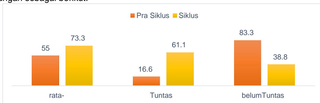
Gambar 1 Diagram Batang Peningkatan Hasil Belajar Siswa Siklus I

Berdasarkan tabel di atas dapat disajikan diagram batang tingkat ketuntasan siswa pada siklus I dalam pembelajaran mata pelajaran PAI kelas V di SD Negeri 3 Munjungan sebagai berikut: