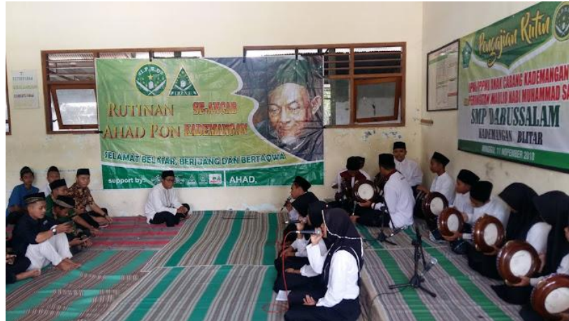
Gambar 4.1 Kegiatan Ekstra sholawatan

“Sekolah mempunyai ekstrakurikuler diantaranya sholawatan, tilawah, Da’l cilik, kerajinan yang setiap seminggu sekali pelaksanaan masing-masing ekatra”.