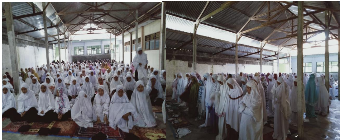
Gambar 4.2 Pelaksanaan Sholat dhuha dan dhuhur berjamaah

“Budaya islami yang ada tidak lepas dari mata pelajaran yang ada, saya terus berfikir dalam merealisasikan kegiatan religius menggunakan metode apa salah satunya yaitu seni sholawatan, ada juga seperti sholat dhuha dan dhuhur berjamaah, safari romadhon, budaya literasi”