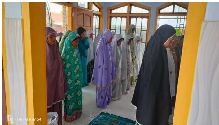
Gambar 4.2 Kegiatan Sholat dhuhur berjamaah

Pelaksanaan sholat dhuhur dilaksanakan secara berjamaah dengan di damping oleh guru PAI beserta guru lainnya. Semuanya melaksanakan sholat secara berjamaah sebelum jam pulang. Biasanya sholat dhuhur secara berjamaah dilaksanakan pukul 12.15 WIB.