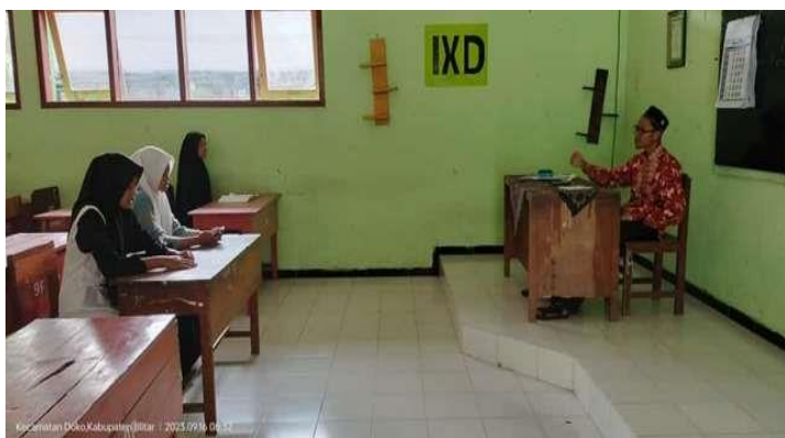
Gambar 4.3 Pemberian Nasehat kepada siswa yang kurang disiplin

yaitu strategi dengan memberikan nasehat dan dilakukan dengan cara guru menegur siswa bila mereka melakukan salah. Strategi ini cukup efektif dan banyak berhasil dalam membentuk kepribadian siswa secara emosional, moral maupun sosial (Yasyakur 2017). Sistem evaluasi dalam pelaksanaan Strategi Guru Pendidikan Agama Islam dalam meningkatkan kedisiplinan beribadah shalat siswa di SMPN 2 Doko Kabupaten Blitar