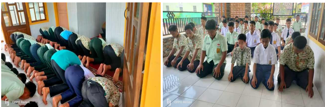
Gambar 4.1 Kegiatan Sholat dhuha berjamaah

Kegiatan sholat dhuha dilaksanakan satu minggu sekali dengan jadwal bergilir yang sudah di susun. Pelaksanaan sholat dhuha biasanya dilaksanakan selama 10 menit di mulai pukul 08.30 dengan di damping guru yang mengampu mata pelajaran masing-masing.